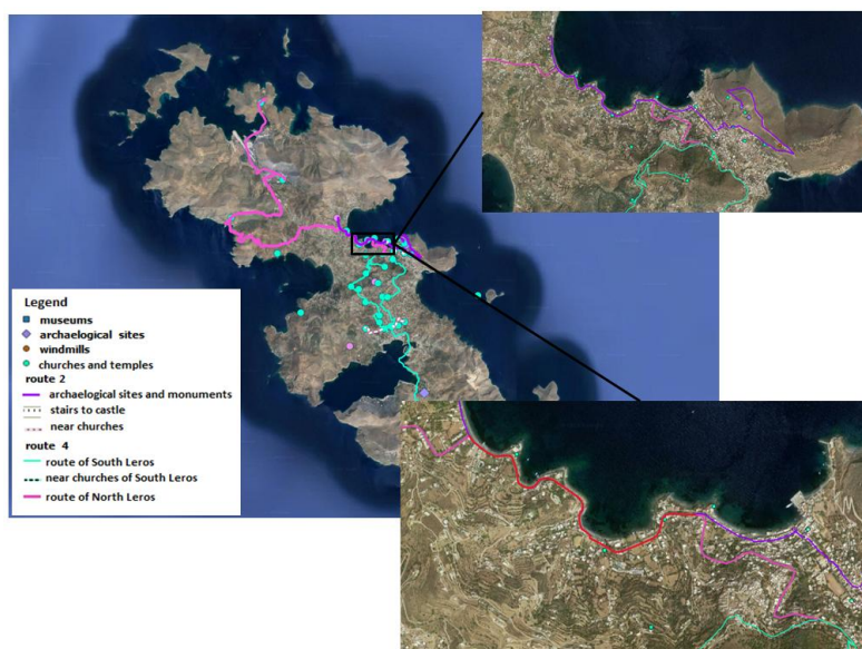
Εικόνα 6: Συνδυαστική Διαδρομή με βάση τον Πολιτισμό.

Μπορούν να δημιουργηθούν και άλλοι συνδυασμοί διαφορετικών διαδρομών, όπως ο συνδυασμός του δρόμου του κρασιού με μία διαδρομή που θα ενώνει τα τέσσερα καταφύγια άγριας ζωής ή ο συνδυασμός της διαδρομής θρησκευτικού ενδιαφέροντος με μία διαδρομή που θα ενώνει τις παραλίες του νησιού, ανάλογα με τις προτιμήσεις και τις ανάγκες του κάθε ενδιαφερόμενου.