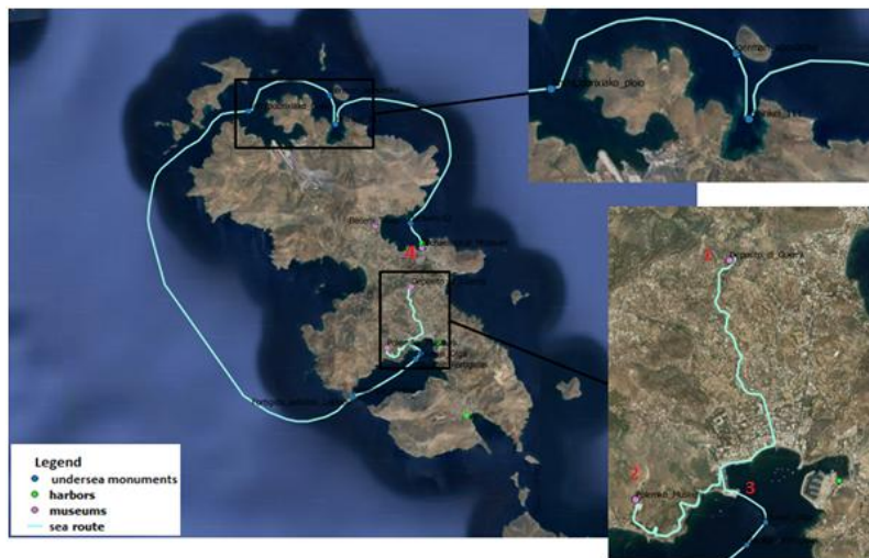
Εικόνα 2: Πολεμικά μουσεία Λέρου και θαλάσσια διαδρομή στα ενάλια αξιοθέατα. (1) Μουσείο Πολεμικών Ευρημάτων «Deposito Di Guerra», (2) Πολεμικό Μουσείο «Τούνελ Μερικιάς», (3) Λιμάνι του Λακκιού, (4) λιμάνι της Αγίας Μαρίνας.

Πρόκειται για διαδρομή συνδυαστική που περιλαμβάνει τα υπέργεια και τα ενάλια μνημεία του Β' Παγκοσμίου Πολέμου (Εικόνα 2). Ξεκινάει από το Μουσείο Πολεμικών Ευρημάτων «Deposito Di Guerra» (1) που βρίσκεται στην Αγία Ειρήνη, στο Λακκί. Η έκθεση του μουσείου περιλαμβάνει ευρήματα από τη μάχη της Λέρου τον Νοέμβριο του 1943, όπως οπλισμό και πυρομαχικά 3 . Στη συνέχεια, οι επισκέπτες μπορούν να μεταφερθούν στο Πολεμικό Μουσείο «Τούνελ Μερικιάς» (2). Πρόκειται για ένα στρατιωτικό τούνελ που έχει αναστηλωθεί και στο χώρο του φιλοξενείται πλήθος εκθεμάτων. Ορισμένα από αυτά βρέθηκαν διάσπαρτα στο νησί ή ανασύρθηκαν από τις θάλασσες του, ενώ κάποια αποτελούν δωρεές του Ελληνικού Στρατού και ορισμένων ιδιωτών. Επιπλέον, στον περιβάλλοντα χώρο του Τούνελ λειτουργεί στρατιωτικό μουσειακό πάρκο που περιλαμβάνει στρατιωτικά αυτοκίνητα, φορτηγά, αεροπλάνα και διάφορα άλλα αντικείμενα ή όπλα 4 .