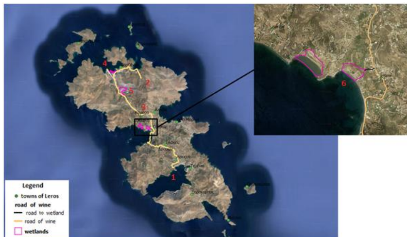
Εικόνα 1: Ο δρόμος του κρασιού και οι υγροτόποι της Λέρου. (1) Λιμάνι Λακκί, (2) Κτήμα της οικογένειας Ησύχου, (3) Οινοποιείο της οικογένειας Χατζηδάκη, (4) Έλος Αγίας Κιουράς ή Παρθενίου, (5) Φράγμα του Παρθενίου, (6) Έλος Γούρνας.

Κατά μήκος της διαδρομής εντοπίζονται δύο από τους τέσσερις υγροτόπους του νησιού, το παράκτιο Έλος Αγίας Κιουράς ή Παρθενίου (4) και το φράγμα του Παρθενίου (5) βορειοδυτικά του οικισμού της Καμάρας, ενώ μπορεί να προσεγγισθεί και το έλος της Γούρνας (6) με τα πόδια, καθώς απέχει 0,12 km από τον κύριο άξονα του δρόμου (Εικόνα 1).