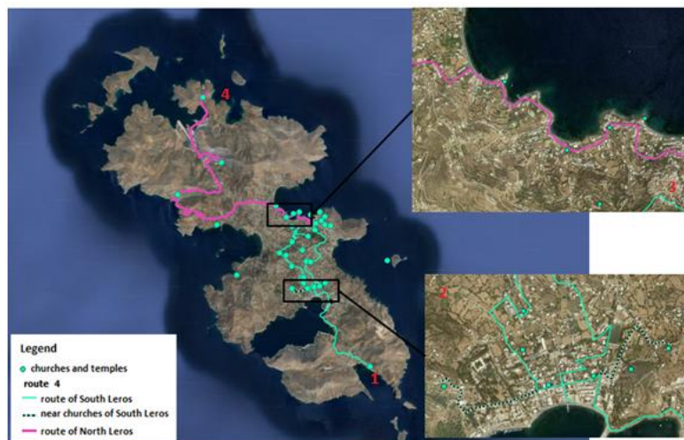
Εικόνα 5: Οι διαδρομές στα μνημεία λατρείας της Βόρειας και της Νότιας Λέρου. (1) Περιοχή του Ξηροκάμπου, (2) Λακκί, (3) Όρια του οικισμού της Αγίας Μαρίας, (4) Εκκλησία Αγία Κιουρά.

Η διαδρομή θρησκευτικού ενδιαφέροντος περιλαμβάνει μνημεία λατρείας σε όλο το νησί. Μπορεί να διακριθεί σε μία διαδρομή που καταλαμβάνει το Νότιο μέρος του νησιού, όπου απαντώνται και τα περισσότερα μνημεία λατρείας, και σε μία που καταλαμβάνει το Βόρειο μέρος της Λέρου (Εικόνα 5). Αντιστοιχεί σε 17,8 km.