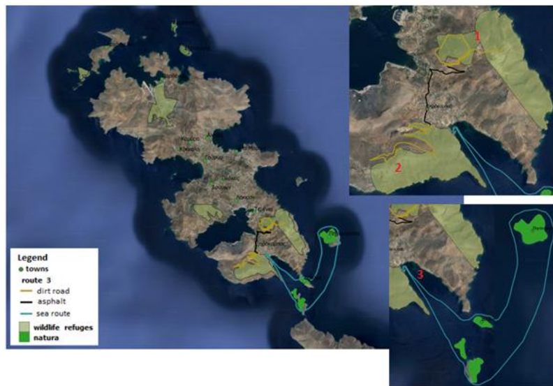
Εικόνα 4: Η διαδρομή στα καταφύγια άγριας ζωής και στις νησίδες που ανήκουν στο Δίκτυο Natura. (1) Διαπόρι, (2) Λόφος Σκουμπάρδος, (3) Λιμάνι του Ξηροκάμπου.

Ο δεύτερος δρόμος επιστημονικής παρατήρησης είναι θαλάσσιος και αφορά την προσέγγιση των νησίδων της Λέρου Γλαρονήσια (Μικρό και Μεγάλο Γλαρονήσι), Πηγανούσα και Βελόνα, με αφετηρία το λιμάνι του Ξηροκάμπου και επιστροφή σε αυτό (3). Αντιστοιχεί περίπου σε 10,5 ναυτικά μίλια.