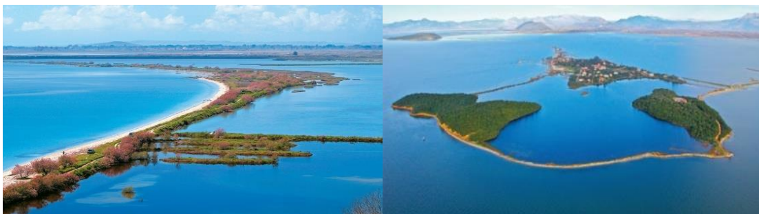
Εικόνα 1: Κορωνησία - Αμβρακικός Κόλπος