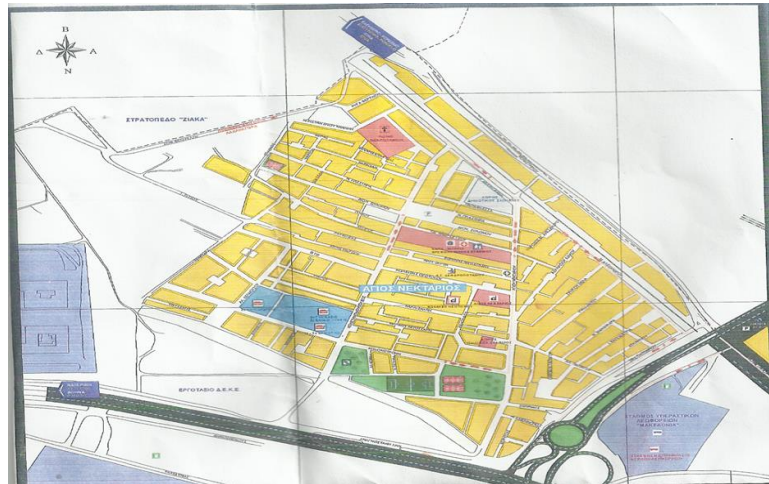
Χάρτης 5: Πολεοδομικός χάρτης Δενδροποτάμου

Η κύρια πολεοδομική δραστηριότητα της περιοχής είναι η αμιγής κατοικία. Από πολεοδομικής απόψεως, η αμιγής κατοικία δεν ενδείκνυται στον αστικό χώρο καθώς δημιουργεί ασυνέχεια στην προσπελασιμότητα του χώρου.